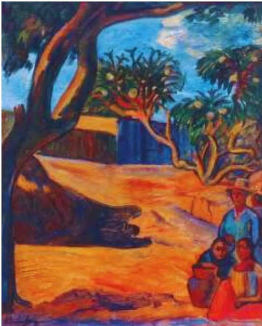
Cuesta del caracucho, 1980 Óleo / Tela. 78 x 65 cm.