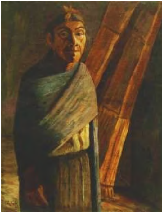
Mi madre, 1944 Óleo / Tela. 76 x 60 cm.