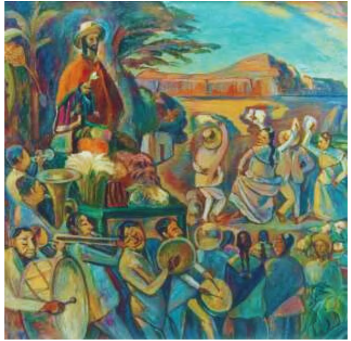
San Isidro Labrador, 1982 Óleo / Tela. 90 x 87 cm.